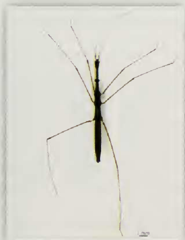
Fig. 8.- Habitus de Hydrometra stagnorum (L.) (♂)

Citas previas: La Palma: ▪ La Caldera de Taburiente (Tenerra), El Paso, 24/V/1947 (Lindberg [17]); La Caldera de Taburiente, El Paso, 24/V/1947 (Lindberg [17]); 12/VI/1995 (García [9]); (Quero y Zarazaga [22]) ▪ Sin precisar localidades (Horváth [15]; Lindberg [16]; Zimmermann [27]; Heiss y Báez [11]; Baena y Báez [3]; Báez y Zurita [4]; Báez et al. [5]; Aukema et al. [2]; Oromí et al. [19]).